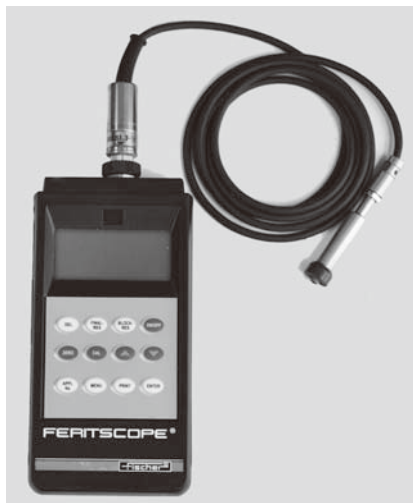
フェライトスコープ